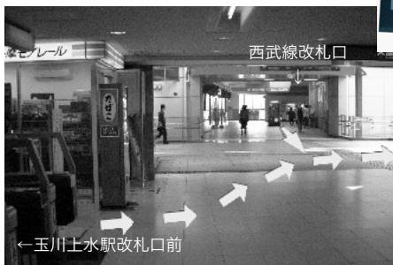
①改札口を出て矢印の方向へ

モノレール・西武線改札口 (一つのみ) →立川市柏町・幸町方面出口→川 (玉川上水) を渡る→駅を背にして左に曲がる→玉川上水沿い遊歩道を東 (新宿方向) へ 所要時間: 徒歩 6~8 分 ※お車でのご来場はご遠慮ください。