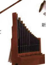
ポルタティーフォルガン