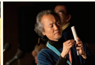
身近な素材で楽器を作る