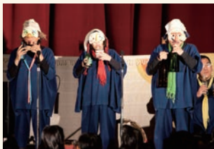
新たな音の世界の発見