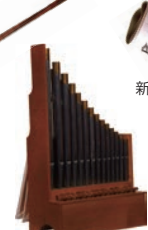
ポルタティーフォルガン