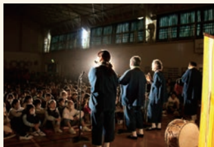
音楽の原点に触れる