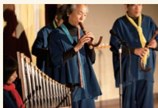
柔らかくて、なつかしい音楽