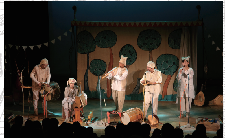
「森のオト」舞台写真

1973年 松本雅隆により中世・ルネサンス音楽を演奏する「カテリーナ古楽合奏団」結成。 1982年 子どもたちに音楽の夢を運ぶべく「ロバの音楽座」結成。ロバの音楽座は古楽器や空想楽器などにより、ファンタジックな音と遊びの世界を繰り広げている。1988年「愉快なコンサート」が厚生省中央児童福祉審議会の特別推薦文化財作品に選ばれる。1998年「ジグの空想音楽会」が東京都優秀児童演劇選定優秀賞受賞。2001年 05年 NHK「おかあさんといっしょ」にゲストとして出演。2004年よりNHK教育ショートアニメ「パンツぱんくろう」「からだであそぼ」などの音楽を担当。2005年 東映教育映画「みみをすます」に出演し話題を呼ぶ。2006年 ジブリ作品「ゲド戦記」の音楽に参加する。2007年イチローの出演するENEOSのCM音楽を担当。2008年NHK教育テレビ「ヒミツのちからんど」のちからマスターとして出演。2009年 第3回キッズデザイン賞・創造教育デザイン部門において金賞(経済産業大臣賞)を受賞。2011年「らくがきビビのコンサート」が児童福祉文化賞 特別推薦を受賞する。